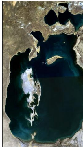
Ιούνιος - Σεπτέμβριος 1989

Η εξαφάνιση της Αράλης συχνά περιγράφεται ως η μεγαλύτερη περιβαλλοντική καταστροφή που έγινε από τον άνθρωπο. Το Καζακστάν καταβάλλει σήμερα προσπάθειες να διασώσει ότι απέμεινε από το βόρειο τμήμα της Αράλης (τη Μικρή Αράλη) κατασκευάζοντας το 2005 ένα φράγμα που ανύψωσε τη στάθμη των υδάτων κατά δυο μέτρα και μείωσε κάπως την αλμυρότητα, επιτρέποντας την επανεμφάνιση ψαριών.