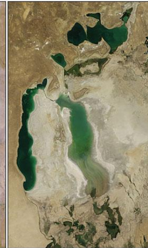
Αύγουστος 2010 www.gbetsis.com