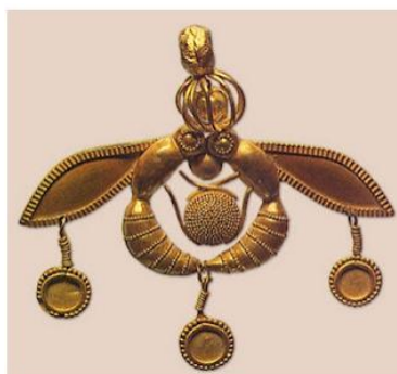
Οι μέλισσες των Μαλίων