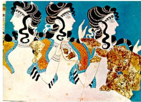
οι κυρίες με τα γαλάζια