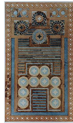
το ζατρίκιο, επιτραπέζιο παιχνίδι (αναπαράσταση)